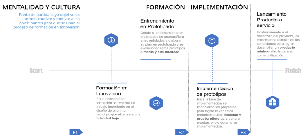
Ilustración 42. línea de tiempo de evolución de los prototipos

La alternativa de solución propone un ejercicio desde la ideación hasta la implementación de un proyecto de innovación que contribuya a los objetivos estratégicos o tenga una contribución directa al mejoramiento de su productividad, esto enfocado en el desarrollo de la competitividad del sector productivo en los Departamentos. Esta alternativa de solución no llegará a la TRL 9 de los prototipos, pero se acompañará a las unidades productivas a buscar otras fuentes de financiación y/o mecanismos para la implementación o fabricación en masa de este nuevo o mejorado proceso, producto o servicio. Por esto se presenta la línea de tiempo que ayuda a entender la evolución de los prototipos y la contribución de cada fase a el crecimiento de los procesos de innovación.