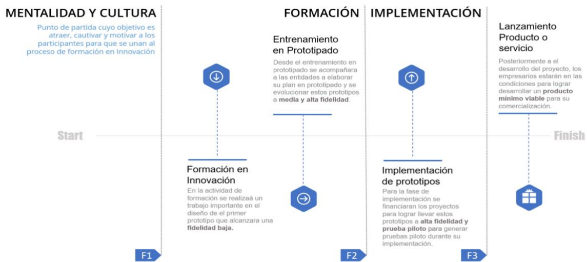
Ilustración 42. línea de tiempo de evolución de los prototipos

La alternativa de solución propone un ejercicio desde la ideación hasta la implementación de un proyecto de innovación que contribuya a los objetivos estratégicos o tenga una contribución directa al mejoramiento de su productividad, esto enfocado en el desarrollo de la competitividad del sector productivo en los Departamentos. Esta alternativa de solución no llegará a la TRL 9 de los prototipos, pero se acompañará a las unidades productivas a buscar otras fuentes de financiación y/o mecanismos para la implementación o fabricación en masa de este nuevo o mejorado proceso, producto o servicio. Por esto se presenta la línea de tiempo que ayuda a entender la evolución de los prototipos y la contribución de cada fase a el crecimiento de los procesos de innovación.