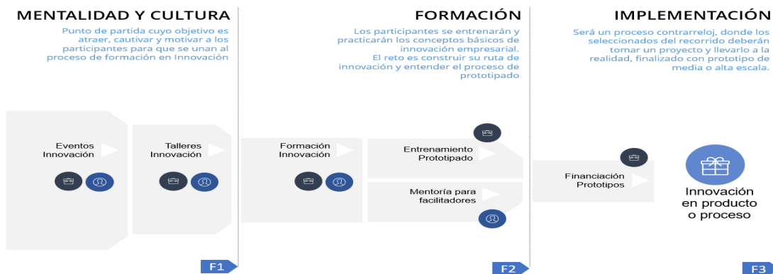
Ilustración Ciclo de vida metodología “Desarrollo de capacidades de la innovación para el desarrollo productivo”

Frente al desarrollo metodológico de las actividades que enmarcan la alternativa de solución definida como “Desarrollo de capacidades en gestión de la innovación para el desarrollo productivo”, se presenta la siguiente ilustración que detalla el proceso metodológico y conceptual e la Alternativa de solución: