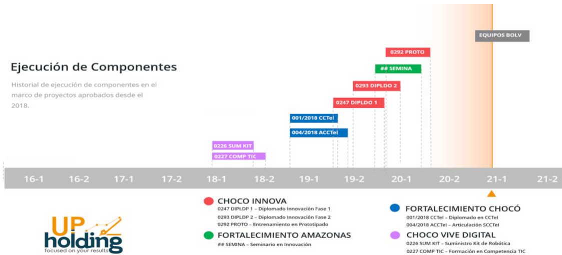
Ilustración 2. Ejecución de componentes

En conclusión, UP HOLDING S.A.S., por su amplio portafolio, sus alianzas estratégicas, sus recursos tecnológicos, su experiencia en diferentes tipos de proyectos y principalmente su Recurso Humano altamente calificado, es uno de los proveedores del mercado que ofrece una cobertura total a la demanda de productos y servicios de innovación, convirtiéndola en uno de los más importantes factores de Integración y desarrollo de proyectos de Ciencia, tecnología e Innovación (CTel).