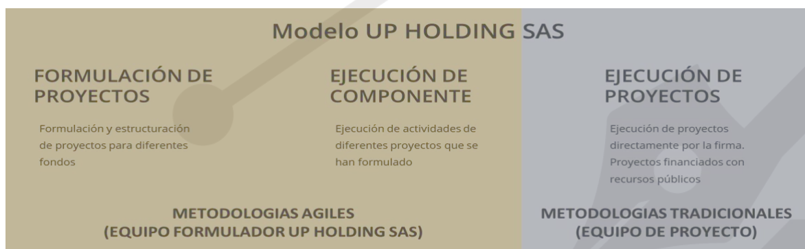
Ilustración 1. Modelo Up Holding SAS

UP HOLDING SAS define tres líneas de negocio que ha venido desarrollando durante los 7 años, estas líneas se presentan a continuación: