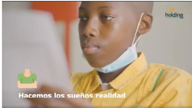
Ilustración 5. Quién es Up Holding SAS (Video)