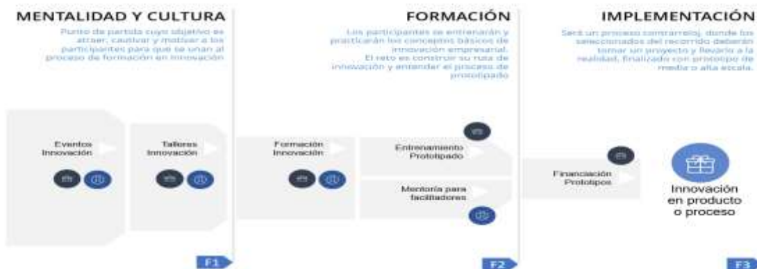
Ilustración Ciclo de vida metodología “Desarrollo de capacidades de la innovación para el desarrollo productivo”

Frente al desarrollo metodológico de las actividades que enmarcan la alternativa de solución definida como “Desarrollo de capacidades en gestión de la innovación para el desarrollo productivo”, se presenta la siguiente ilustración que detalla el proceso metodológico y conceptual e la Alternativa de solución: