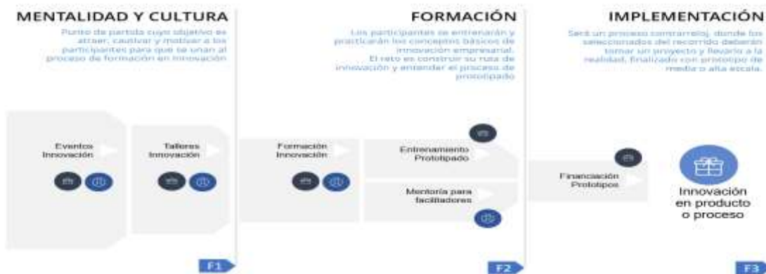
Ilustración Ciclo de vida metodología “Desarrollo de capacidades de la innovación para el desarrollo productivo”

Frente al desarrollo metodológico de las actividades que enmarcan la alternativa de solución definida como “Desarrollo de capacidades en gestión de la innovación para el desarrollo productivo”, se presenta la siguiente ilustración que detalla el proceso metodológico y conceptual e la Alternativa de solución: