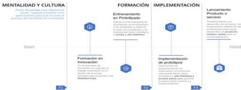
Ilustración 1. línea de tiempo de evolución de los prototipos

Por lo tanto, esta alternativa de solución propone un ejercicio desde la ideación hasta la implementación de un proyecto de innovación que contribuya a los objetivos estratégicos o tenga una contribución directa al mejoramiento de su productividad, esto enfocado en el desarrollo de la competitividad del sector productivo en el Departamento. Esta alternativa de solución no llegará a la TRL 9 de los prototipos, pero se acompañará a las unidades productivas a buscar otras fuentes de financiación y/o mecanismos para la implementación o fabricación en masa de este nuevo o mejorado proceso, producto o servicio. Por esto se presenta la línea de tiempo que ayuda a entender la evolución de los prototipos y la contribución de cada fase a el crecimiento de los procesos de innovación.