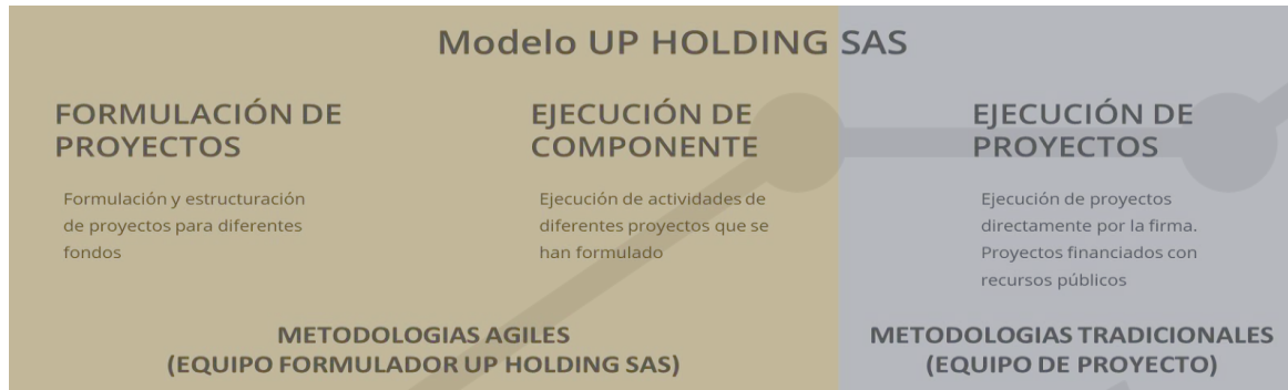
Ilustración 1. Modelo Up Holding SAS

UP HOLDING SAS define tres líneas de negocio que ha venido desarrollando durante los 7 años, estas líneas se presentan a continuación: