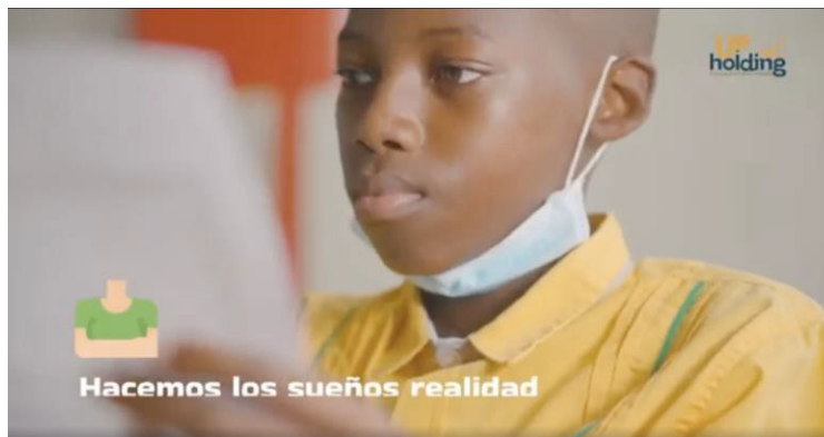
Ilustración 5. Quién es Up Holding SAS (Video)

UP HOLDING S.A.S., es reconocida por ser una de las empresas privadas ejecutoras de proyectos de Ciencia, Tecnología e Innovación con recursos del Sistema General de Regalías (SGR), debido en gran parte a la dinámica interacción que ha tenido con los diferentes aliados estratégicos (Cámara de Comercio, Parquesoft, Gobernaciones, Universidades y Alcaldías) en los 13 departamentos de Colombia donde se han ejecutado este tipo de proyectos de inversión.