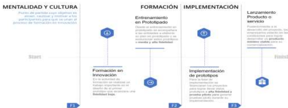
Ilustración 1. línea de tiempo de evolución de los prototipos

Por lo tanto, esta alternativa de solución propone un ejercicio desde la ideación hasta la implementación de un proyecto de innovación que contribuya a los objetivos estratégicos o tenga una contribución directa al mejoramiento de su productividad, esto enfocado en el desarrollo de la competitividad del sector productivo en el Departamento. Esta alternativa de solución no llegará a la TRL 9 de los prototipos, pero se acompañará a las unidades productivas a buscar otras fuentes de financiación y/o mecanismos para la implementación o fabricación en masa de este nuevo o mejorado proceso, producto o servicio. Por esto se presenta la línea de tiempo que ayuda a entender la evolución de los prototipos y la contribución de cada fase a el crecimiento de los procesos de innovación.