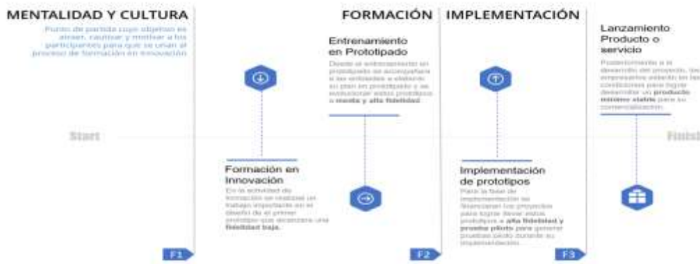
Ilustración 1. línea de tiempo de evolución de los prototipos

Por lo tanto, esta alternativa de solución propone un ejercicio desde la ideación hasta la implementación de un proyecto de innovación que contribuya a los objetivos estratégicos o tenga una contribución directa al mejoramiento de su productividad, esto enfocado en el desarrollo de la competitividad del sector productivo en el Departamento. Esta alternativa de solución no llegará a la TRL 9 de los prototipos, pero se acompañará a las unidades productivas a buscar otras fuentes de financiación y/o mecanismos para la implementación o fabricación en masa de este nuevo o mejorado proceso, producto o servicio. Por esto se presenta la línea de tiempo que ayuda a entender la evolución de los prototipos y la contribución de cada fase a el crecimiento de los procesos de innovación.