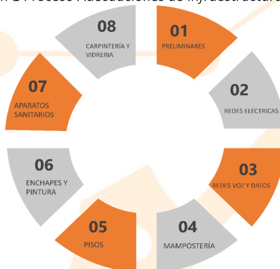
Ilustración 1 Proceso Adecuaciones de infraestructura y eléctricas

El proceso para realizar las respectivas adecuaciones se compone por una serie de fases, sucesivas necesarias para materializar el proyecto en términos de infraestructura. A continuación, se presenta un diagrama del proceso de adecuaciones: