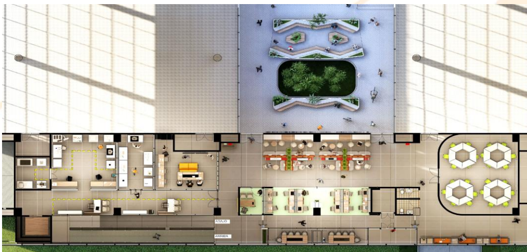
Ilustración 2 Render Nivel 1 Centro de Innovación y Productividad del Huila

Nota: Como referenciación de las adecuaciones locativas a realizar se presentan el render muestra (Anexo 3).